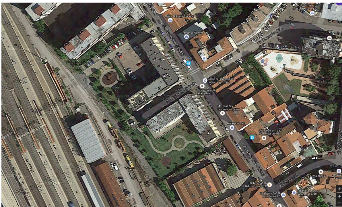
Vista aerea dell'area di intervento (Google Earth)