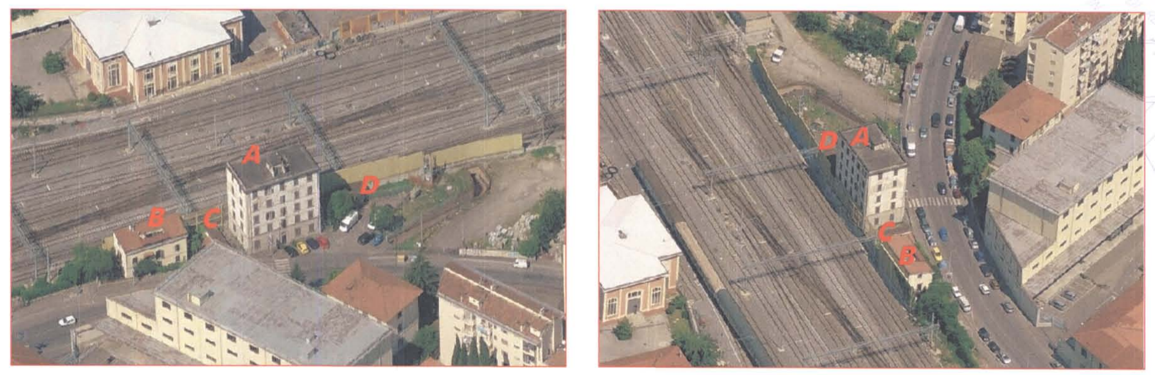
Viste aeree fabbricati in demolizione