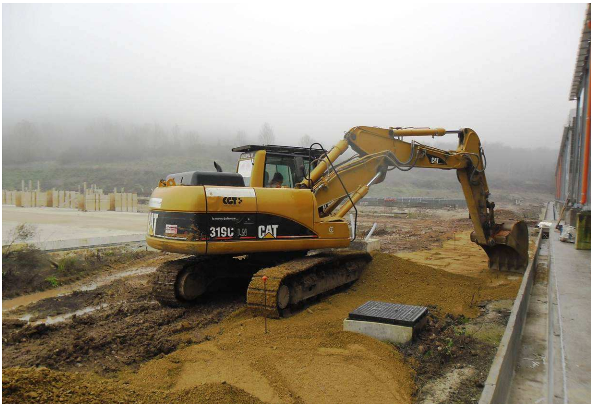
FOTO 2 – Località S. Barbara – Completamento viabilità piazzole 7 – 8