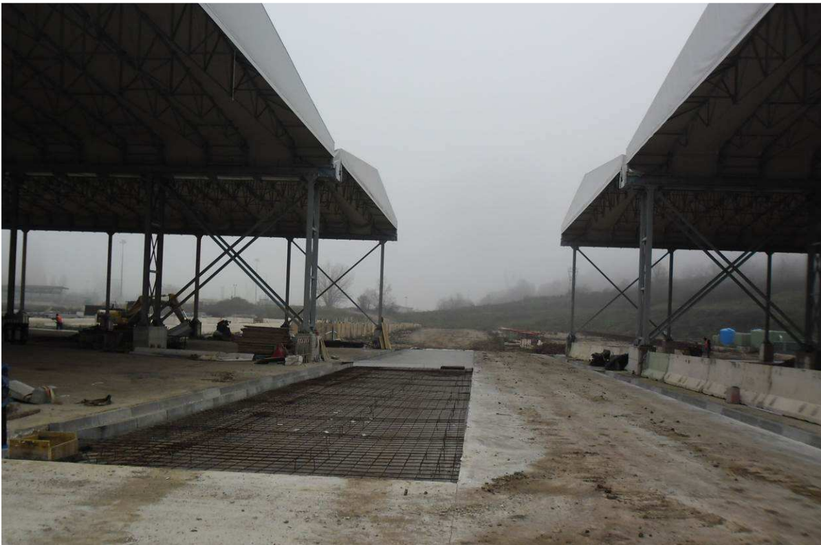
FOTO 1 – Località S. Barbara – Completamento viabilità piazzole 5 – 6