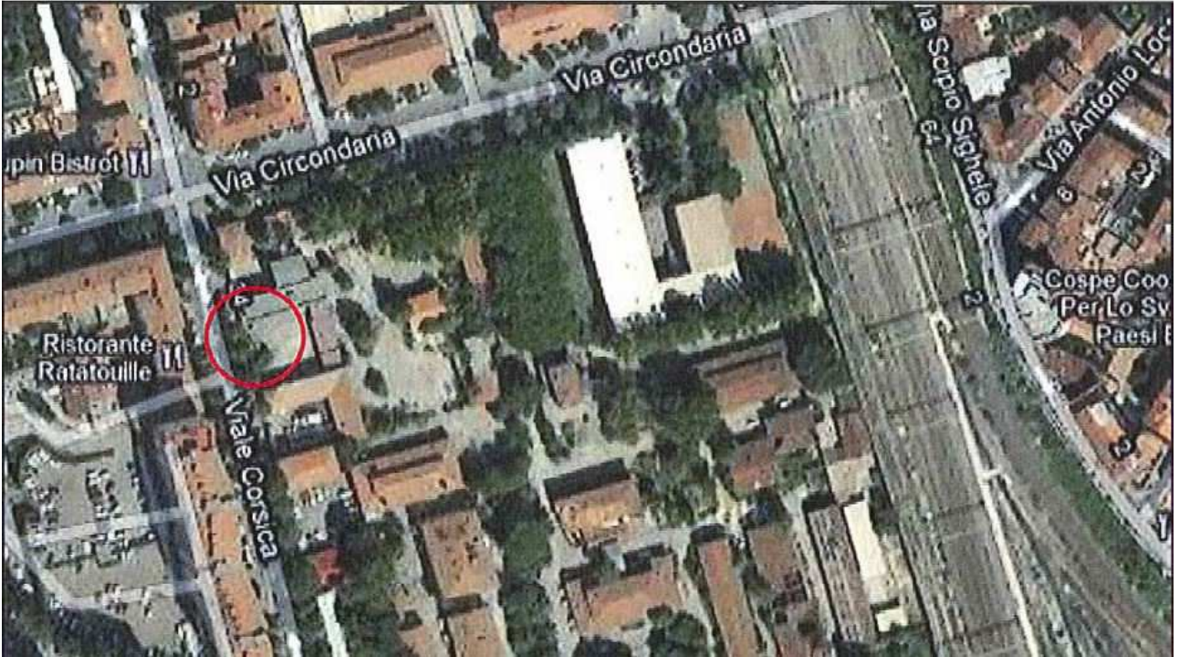
Allegato 1: Passo carrabile via di fuga Viale Corsica