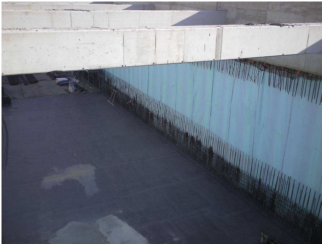
FOTO 2 – Trincea - continua la realizzazione della struttura interna in c.a.