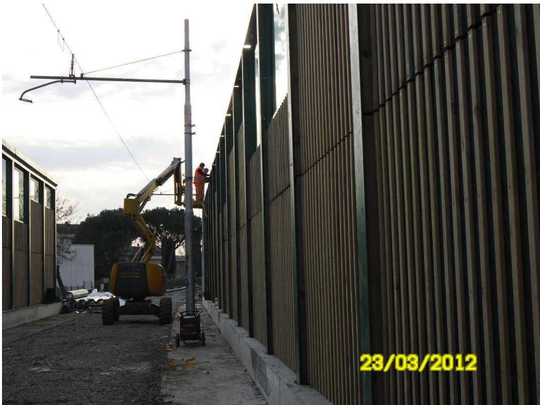
FOTO 8 – Località S. Giovanni Valdarno – montaggio barriere antirumore