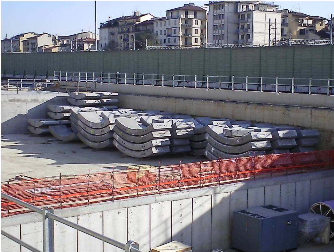
FOTO 5 – Pozzo lancio frese – approvvigionamento conci prefabbricati