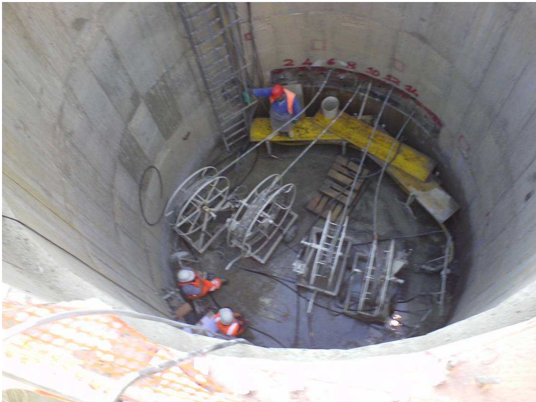
FOTO 6 – Pretrattamento preesistenze – edifici area Ponte al Pino