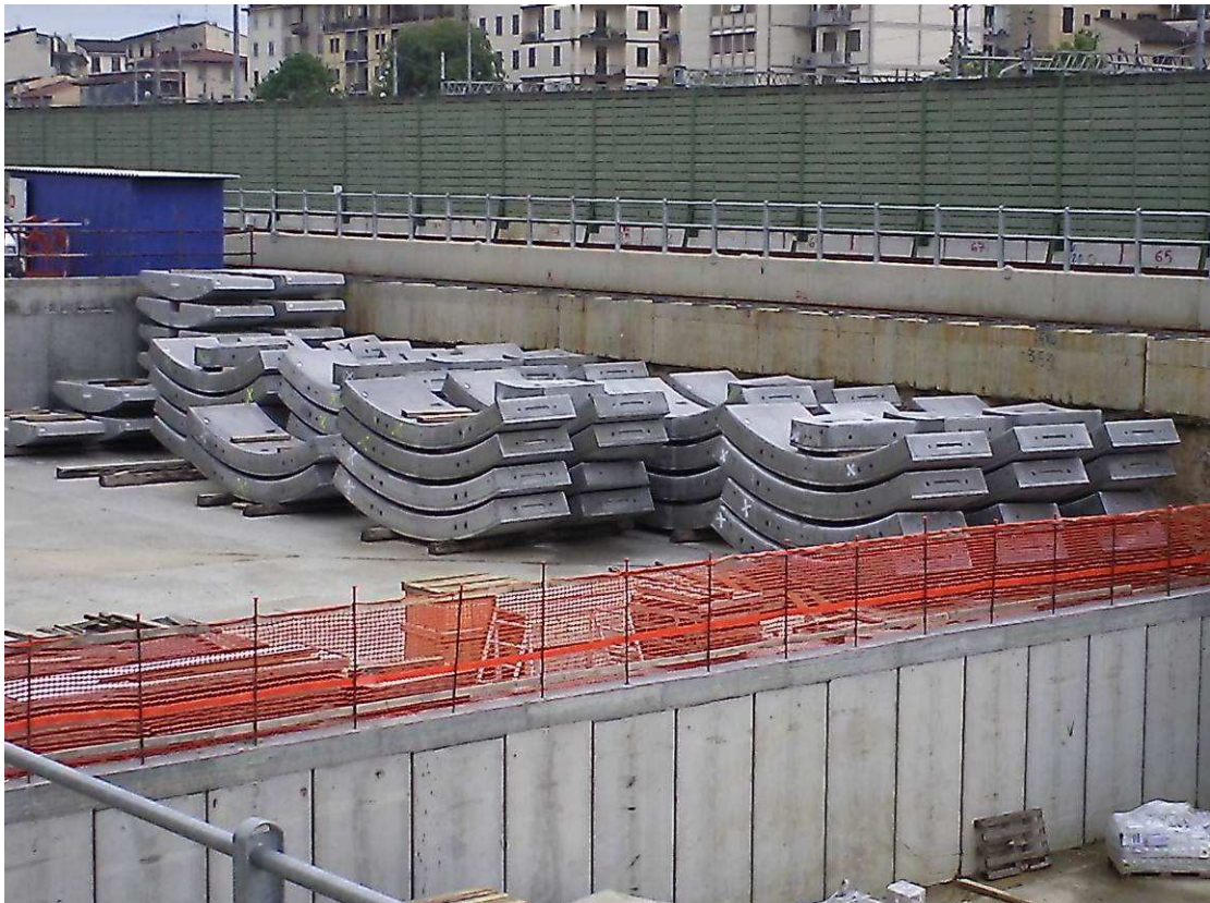
FOTO 4 – Pozzo lancio frese – approvvigionamento conci prefabbricati