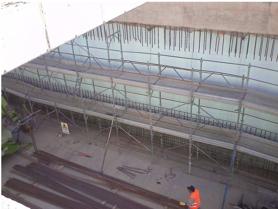
FOTO 2 – Trincea - continua la realizzazione della struttura interna in c.a.