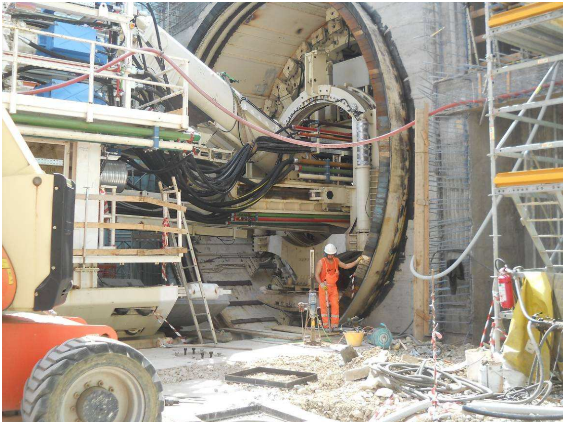
FOTO 5 – Perforazioni necessarie all'ancoraggio della struttura di spinta della TBM