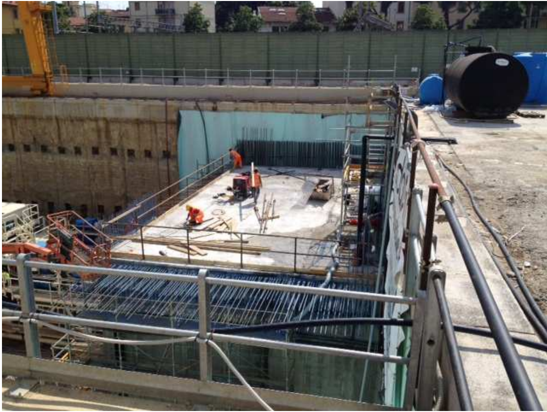
FOTO 4 – Portale imbocco sud lato binario pari – realizzazione soletta quota piano parcheggio