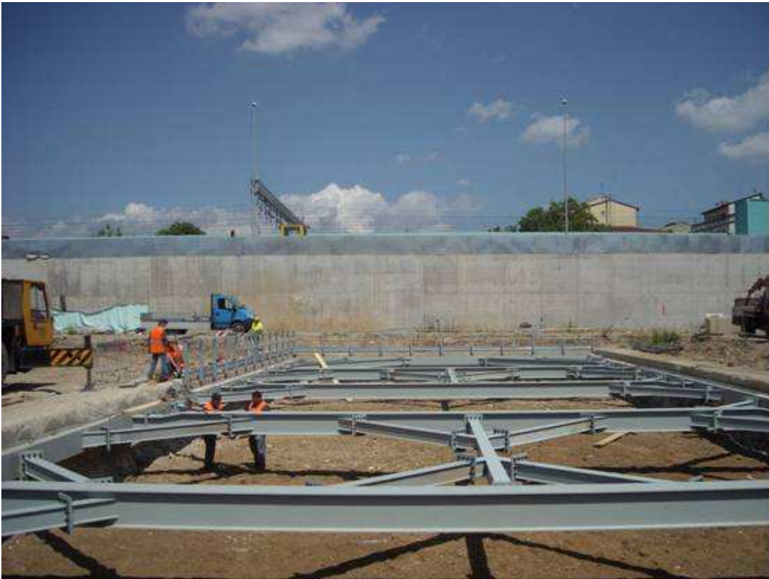
FOTO 2 – Pozzo di ventilazione nord – montaggio parapetto perimetrale e strumentazione di monitoraggio delle centine metalliche