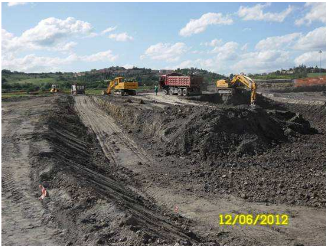
FOTO 4 – Località S.Barbara – movimentazione terre area piazzole di caratterizzazione