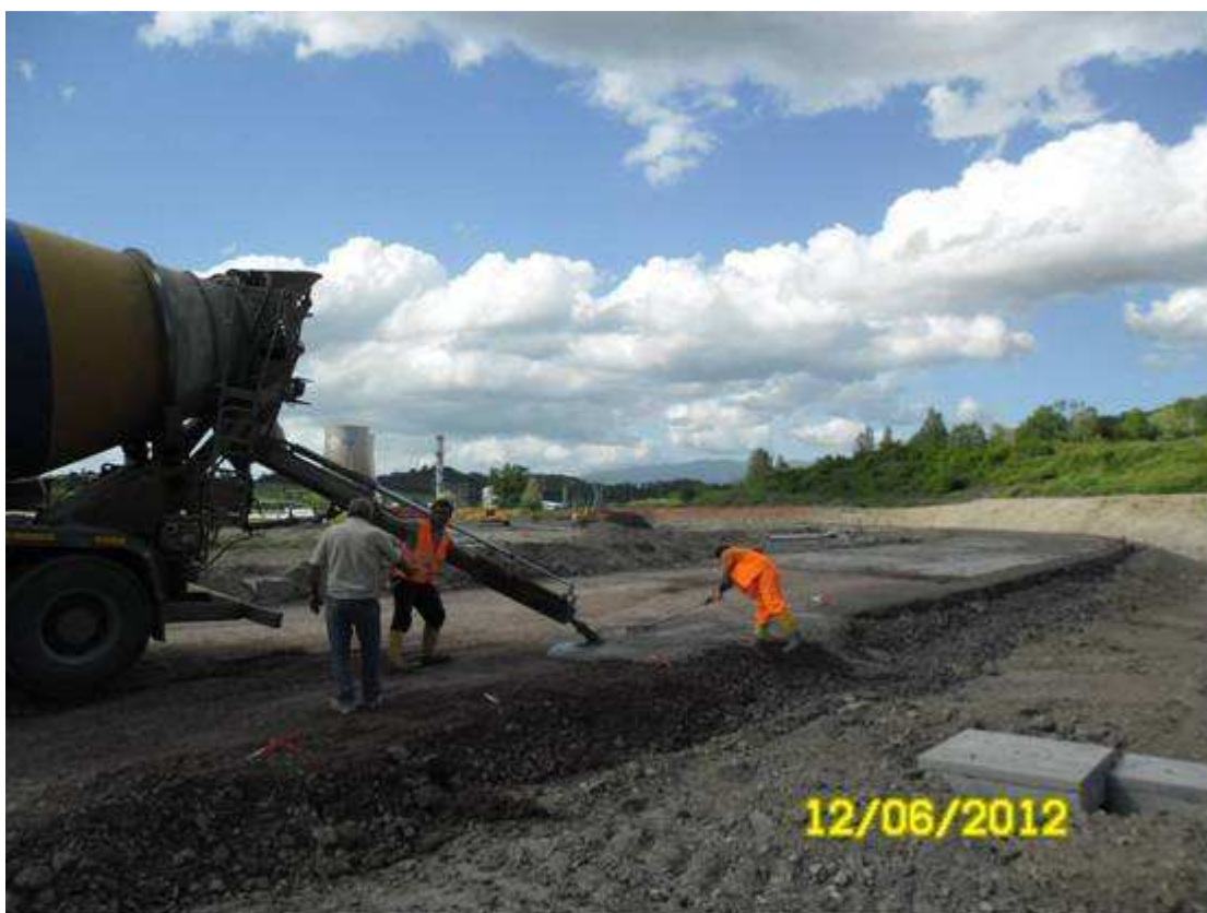
FOTO 5 – Località S.Barbara – completamento viabilità di servizio