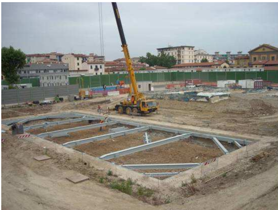
FOTO 1 – Pozzo di ventilazione nord – assemblaggio centine metalliche