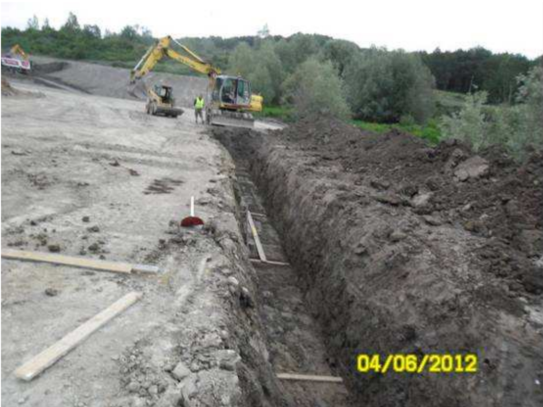
FOTO 3 – Località S.Barbara – realizzazione idraulica viabilità di servizio