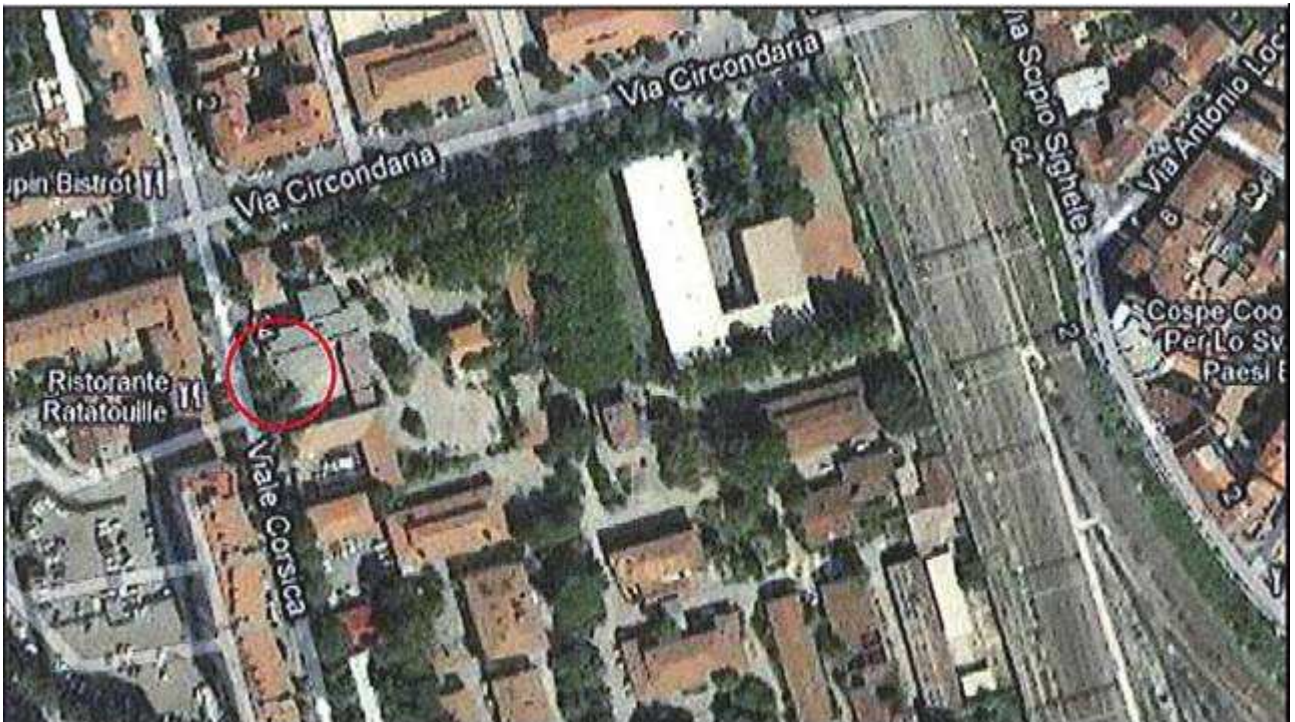
Allegato 1 : Passo carrabile via di fuga Via Corsica