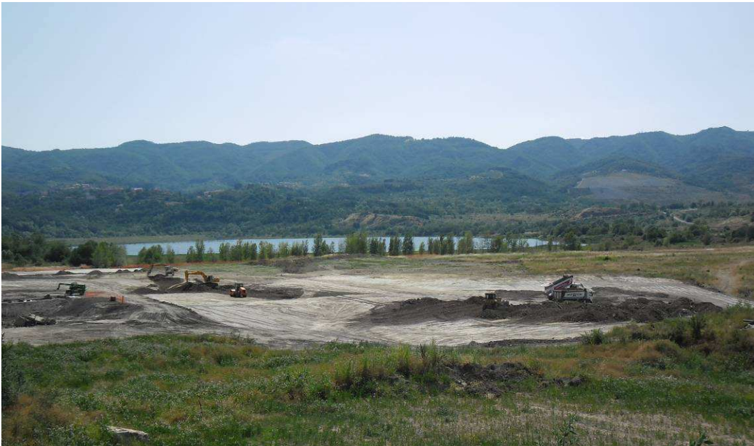
FOTO 2 – Località S.Barbara – Piazzole di stoccaggio – Movimenti terra