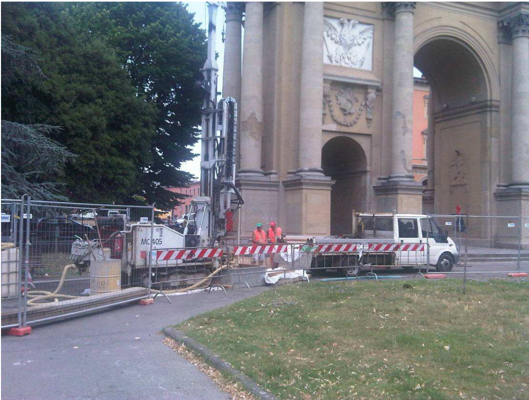
FOTO 6 – Piazza della Libertà – Installazione monitoraggio lungo linea