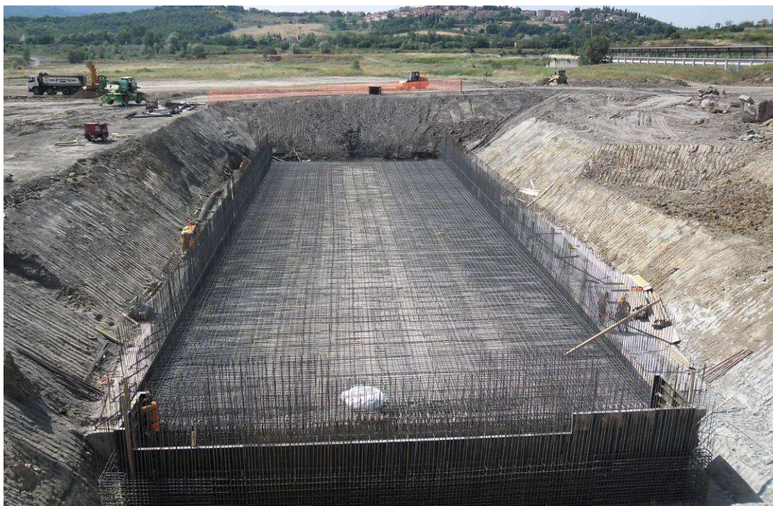
FOTO 1– Località S.Barbara – Vasca di accumulo impianto di trattamento