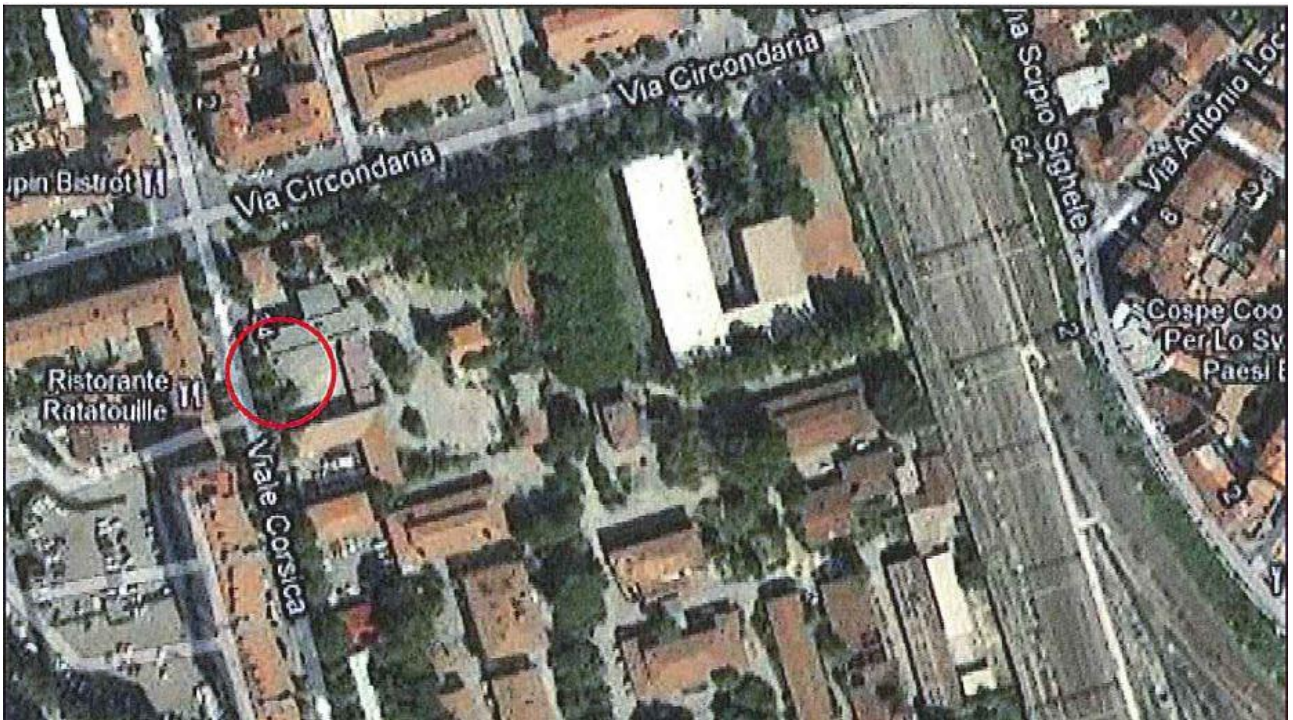
Allegato 1: Passo carrabile via di fuga Viale Corsica