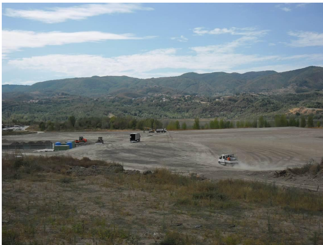
Foto 1: Località S. Barbara – Piazzole di stoccaggio – Movimenti terra