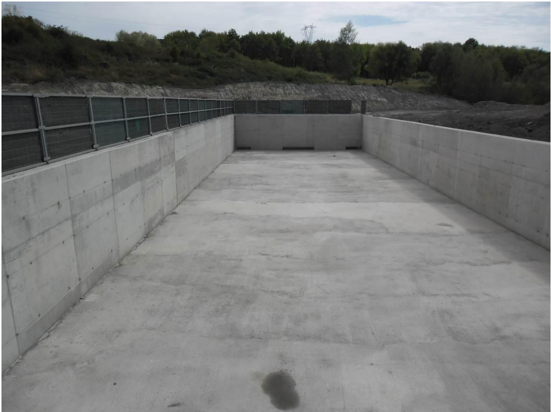
Foto 2: Località S. Barbara – Vasca di accumulo impianto di trattamento