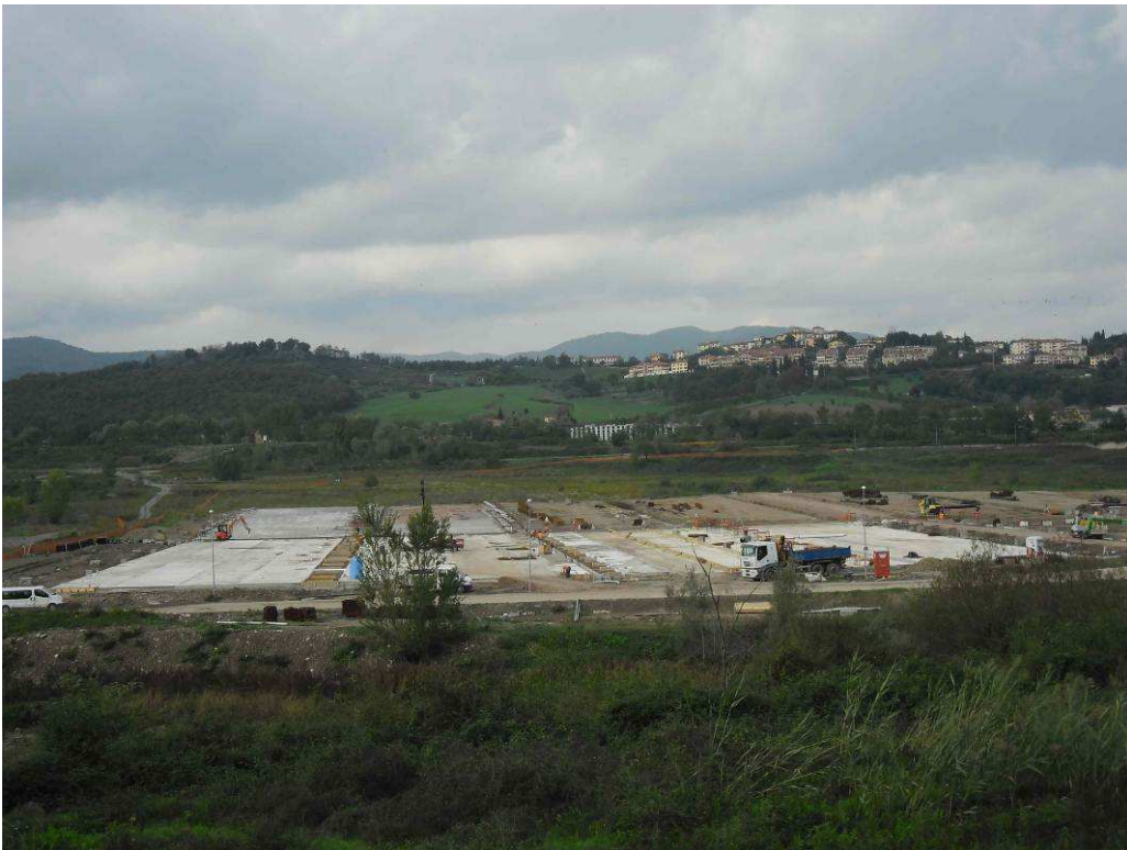
Foto 1– Località S.Barbara – Piazzole di stoccaggio Fase 2 – Movimenti terra e fondazioni