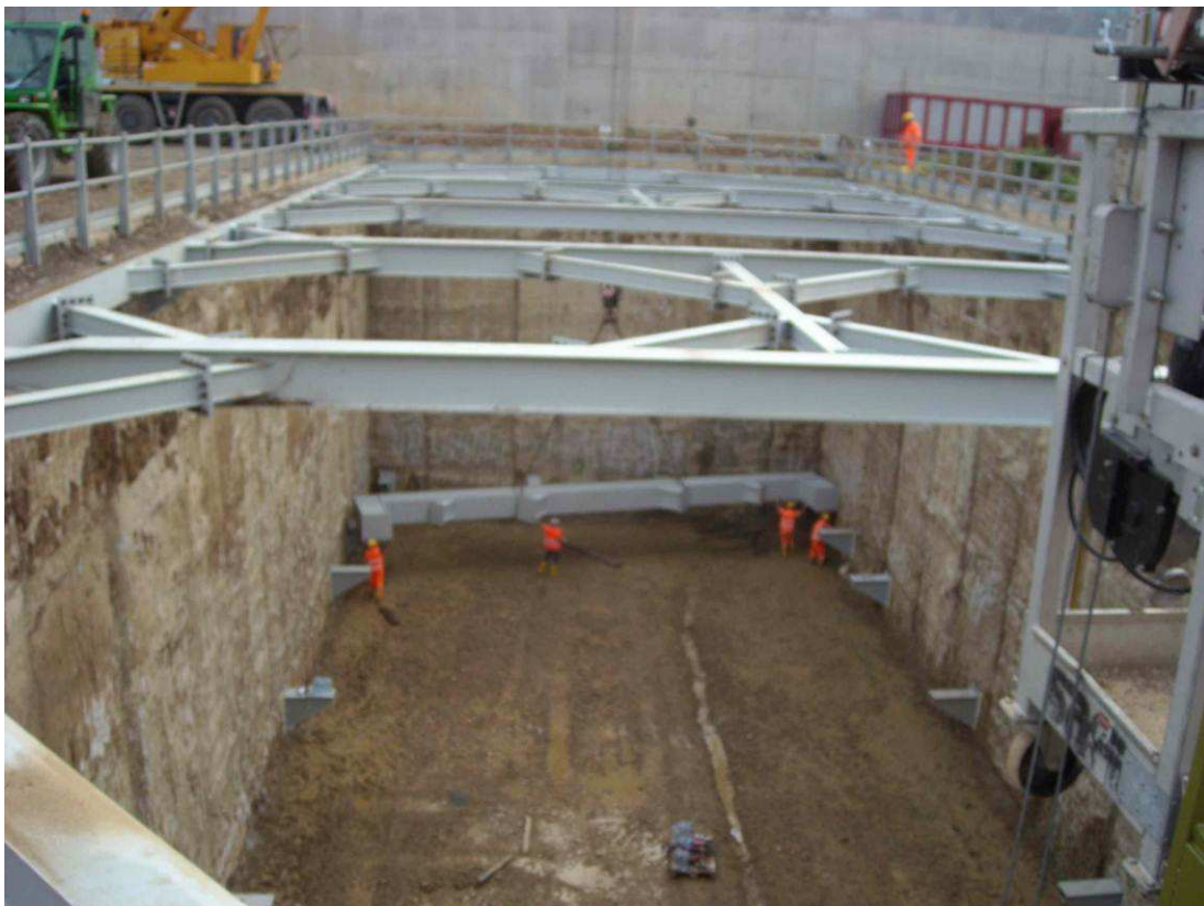
Foto 3 – Pozzo di ventilazione nord – Montaggio 2° ordine di centine