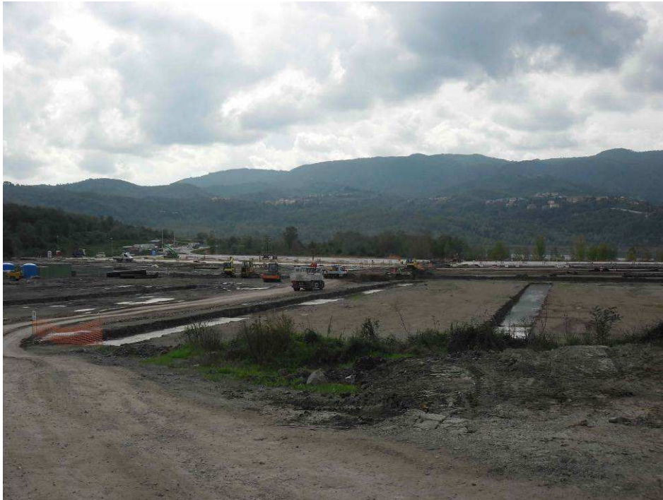
Foto 2– Località S.Barbara – Piazzole di stoccaggio Fase 2 – Fondazioni