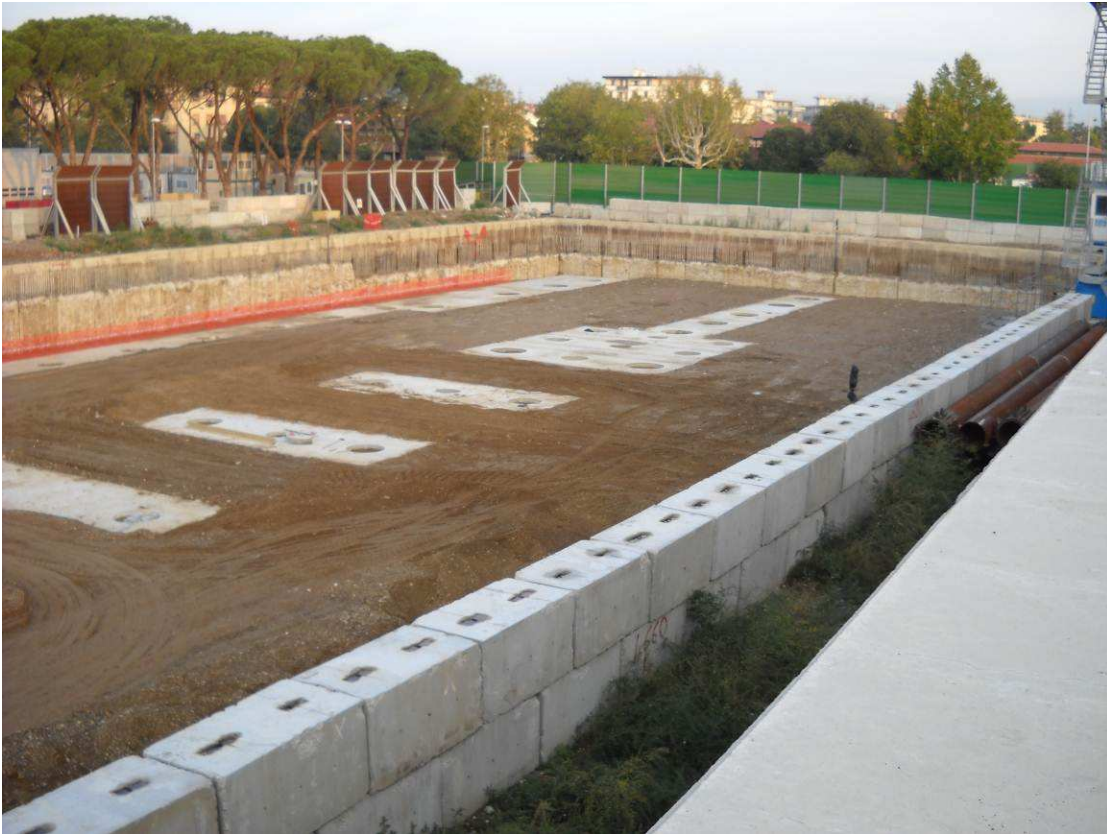
Foto 2-platee-guida in cls per pali-colonna