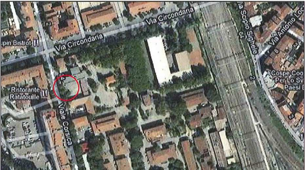
Allegato 1: Passo carrabile via di fuga Viale Corsica