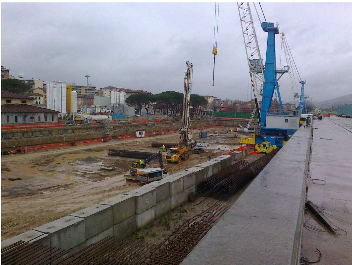
FOTO 1 - Pali di fondazione