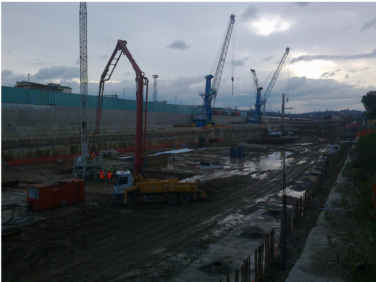
FOTO 1 - Pali di fondazione