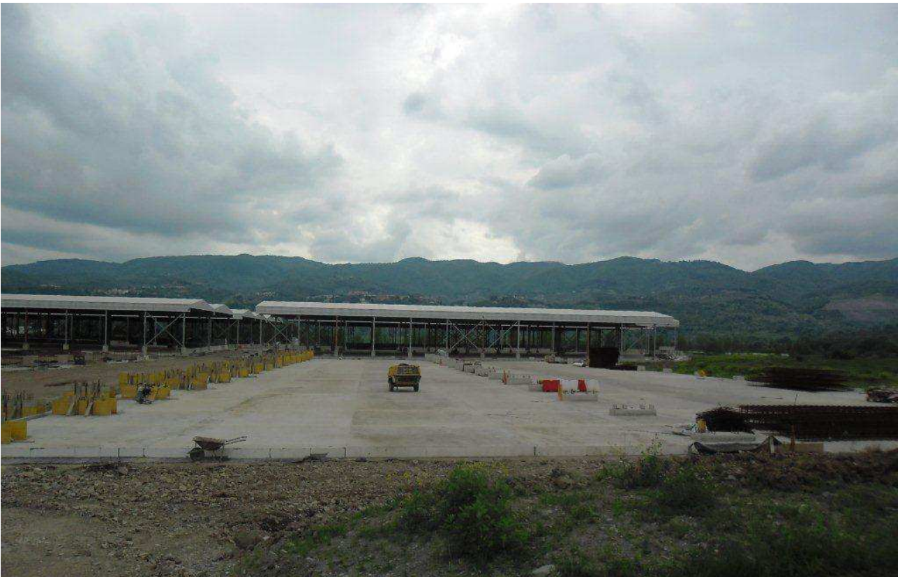
FOTO 1 – Piazzole di stoccaggio – Giunti di costruzione e dilatazione termica