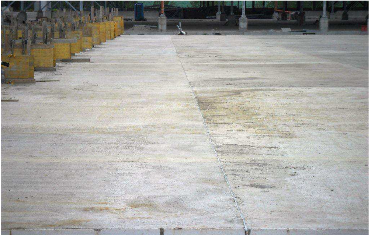
FOTO 2 – Piazzole di stoccaggio – Giunti di costruzione e dilatazione termica